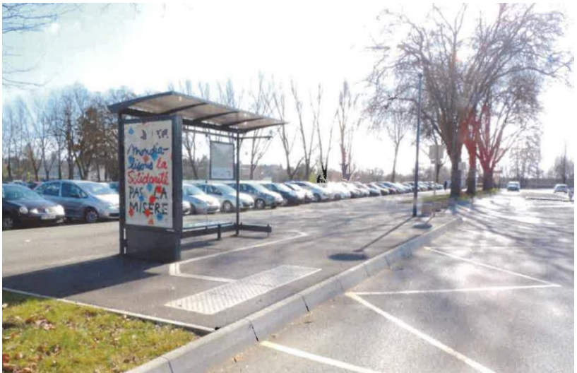
Dole, Stade municipal