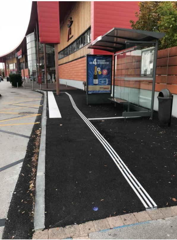
Dole, Grandes Epenottes 1