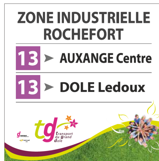
Exemple tête de poteau

GRAND DOLE – Place de l'Europe - 39100 DOLE - info@grand-dole.fr